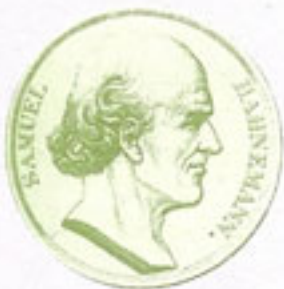
Samuel Hahnemann (médico alemán creador de la ciencia Homeopática) A finales del siglo XVIII rechazó los tratamientos agresivos de la medicina de la época y elaboró los principios de la medicina homeopática.

"la dilución cada vez mayor del producto homeopático no disminuye su actividad, con tal de que se haga una sucesión (proceso rítmico y enérgico) cautelosa a cada paso. Al contrario, se elimina la toxicidad y a menudo se ponen de relieve nuevas propiedades, sobre todo a nivel psíquico"